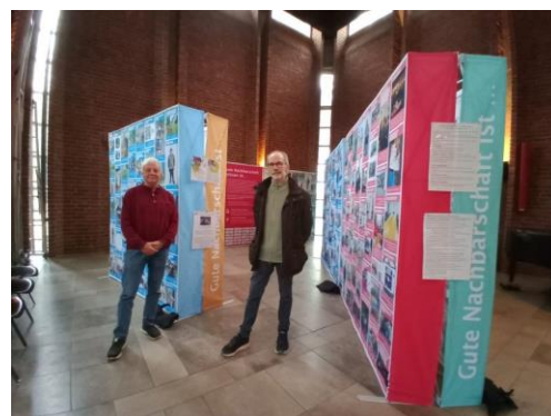
Ausstellung „Gute Nachbarschaft“ in der Bonhoeffer-Kirche