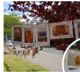
Mit der Foto-Ausstellung „Gute Nachbarschaft ist...“ beteiligte sich der Präventionsrat Buchholz-Kleefeld am Nachbarschaftstag im spar+bau-Treffpunkt in der Käthe-Steinitz-Str.