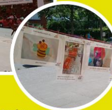
Die Bilder sind Teil einer Niedersachsen-weiten Wanderausstellung der Landschaftsgemeinschaft (LAG) Soziale Brennpunkte Niedersachsen e.V.