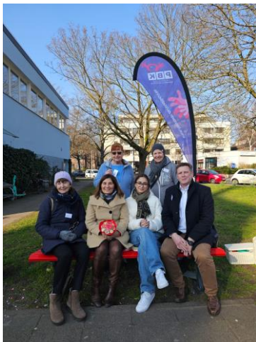
Weltfrauentag an der Roten Bank, 8.3.24