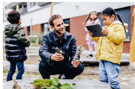
Christoph Wehrer / © Stiftung Kinder forschen