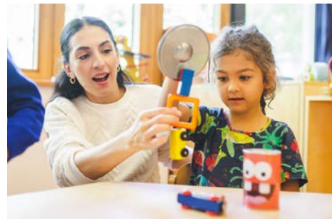
Christoph Wehrer / © Stiftung Kinder forschen