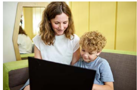
René Arnold / © Stiftung Kinder forschen