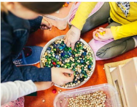
Christoph Wehrer / © Stiftung Kinder forschen