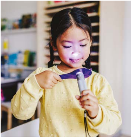
Christoph Wehrer / © Stiftung Kinder forschen