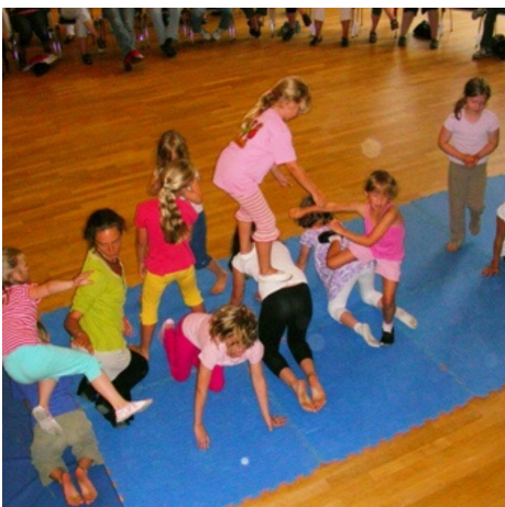
Dienstags Urheber: LHH

Laufzeit: Halbjahreskurs 06.08.-17.12.2024, wöchentlich 45 Minuten Entgelt: Halbjahresbetrag 126,- € (21,-€ monatlich) pro Paar, Ermäßigungen möglich Ort: Bürgerhaus Misburg, Seckbruchstraße 20, 30629 Hannover Veranstalter*in: Musikschule der Landeshauptstadt Hannover Anmeldung und weitere Infos direkt bei der Musikschule: Musikschule der Landeshauptstadt Hannover Maschstr. 22-24, 30 169 Hannover Tel. 168-44137 und www.musikschule-hannover.de