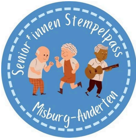
Senior*innen Stempelpass

Veranstalter*in: Kommunaler Seniorenservice Hannover