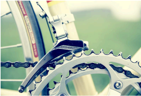
Fahrrad reparieren

jeden 2. und 4. Donnerstag von 15:00 - 17:00 Uhr