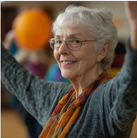
Fit im Alter

Donnerstags, ab dem 14.11.2024, 11:45-12:30 Uhr