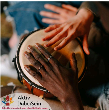
Aktiv DabeiSein Selbstbestimmt mit und ohne Behinderungen Freitags

Anmeldung und weitere Infos: rightnow-hannover.de , Sabine Mertins, Tel. 0176 44591071