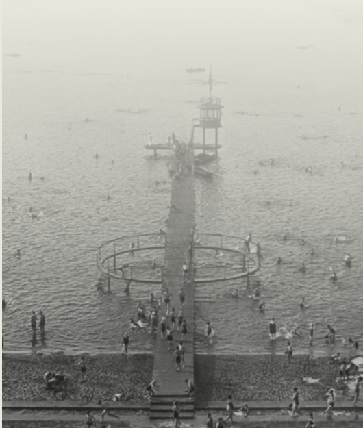
Abb.: Postkarte Kunstverlag Heinrich Thies, Hannover