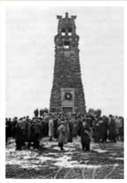
Abb. Postkarte, 1912

Das Bismarckdenkmal in der Masch wurde am 10.5.1933 Schauplatz der von den Nationalsozialisten inszenierten Bücherverbrennungen.