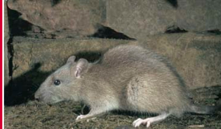
Серая крыса, пасюк Rattus norvegicus

НЕЗАМЕТНО ОТ ГЛАЗ БОЛЬШИНСТВА ЛЮДЕЙ ПОД ГОРОДАМИ СУЩЕСТВУЕТ ЦЕЛАЯ ПОПУЛЯЦИЯ КРЫС-ПАСЮКОВ.