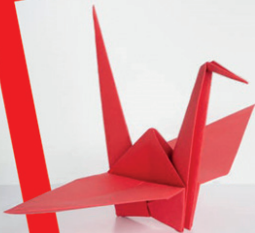
21.8. „Origami für Anfänger – Einfach Falten“

Freizeitheim Döhren | Kulturinitiative Döhren-Wülfel-Mittelfeld e.V.