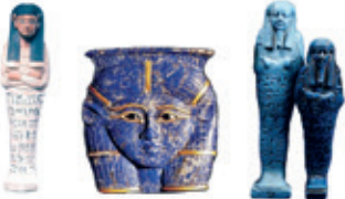
Abb.: © Jane Wyrwa

In diesem Ferienprojekt wollen wir uns die Kultur des alten Ägyptens ansehen und Tonobjekte nach altägyptischen Vorbildern modellieren. Obwohl die Zeit der alten Pharaonen schon vor mehr als 5.000 Jahren begann, ist noch viel von ihrer Kultur erhalten. Lassen wir uns inspirieren von ihrer Kunst. Wir töpfeln kleine Statuen, Sarkophage, modellieren eine Sphinx, und vieles andere mehr. Nach dem ersten Brand, dem Schrühbrand, könnt Ihr alles mit bunten Glasuren bemalen.